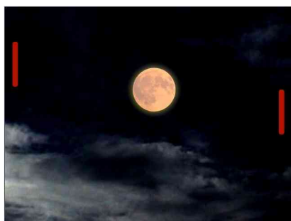
C la lune

Les média qu'il explore sont la vidéo, la création sonore et l'installation. Ses pièces distillent l'idée de temps, l'idée de rencontre et questionnent le sens "d'être là". Souvent la question de la démarche artistique trouve une résonance dans la vision qu'a l'artiste du monde. La sienne sans être désespérée ou dramatique est plutôt sombre, si elle peut être frontale et dure elle est aussi teintée d'humour, parfois tendre et souvent se régale d'absurde.