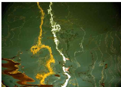
Grimaud octobre 2008

Il expose en galerie depuis une dizaine d'année.