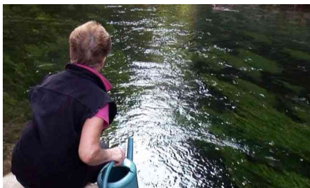
Que nous reste-t-il du paradis ?

Les trois vidéos réalisées à cette occasion seront intégrées dans une installation, que Robert Milin présentera lui-même. Nous donnerons aussi à revoir « Allez viens donc ! » qui montrait des images de paysages tels qu'il se présentent aux vaches et des enregistrements sonores d'éleveurs les appelant. On y entendait des cris, ceux d'un paysage en crise, regardé par la vache, le plasticien ayant choisi de renverser le point de vue vers ce paysage devenu sujet.