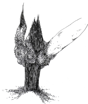
Sans titre

poésie de ses dessins «psychotaumatiques» nous renvoie à celle de Lewis Carroll, à l'onanisme de Dali et au raffinement de François Boucher.