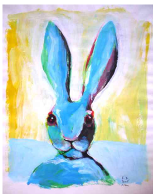
Lièvre 5/01/2005 © Jean Clerc

Aujourd'hui, longtemps après ce livre pour moi euphorique, je ne peins plus de lièvres. Je contemple la plaine de la fenêtre du train, j'écoute le vent dans les branches, je m'assois au bord d'une rivière, et je me relève en souriant. »