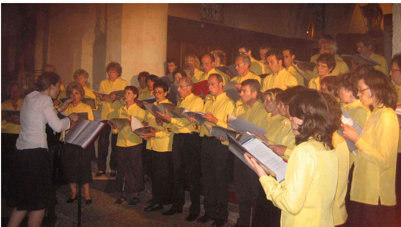
A travers chants